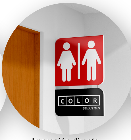
Impresión directa sobre PVC