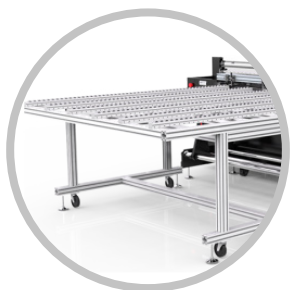
Soporte frontal y trasero