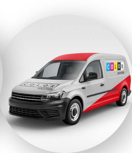
Rotulación de Flotilla vehicular