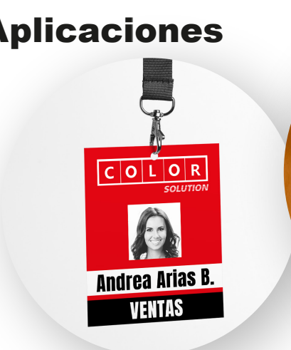
Impresión sobre Polipropileno